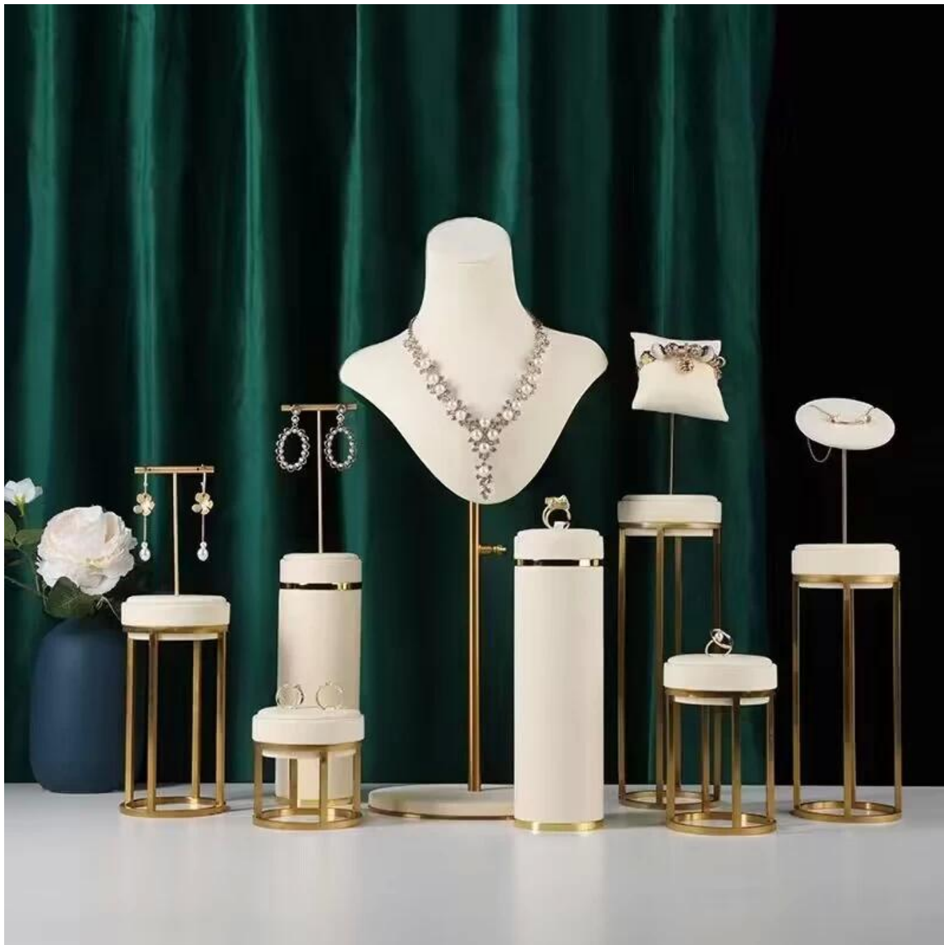
Escritório de Yadao