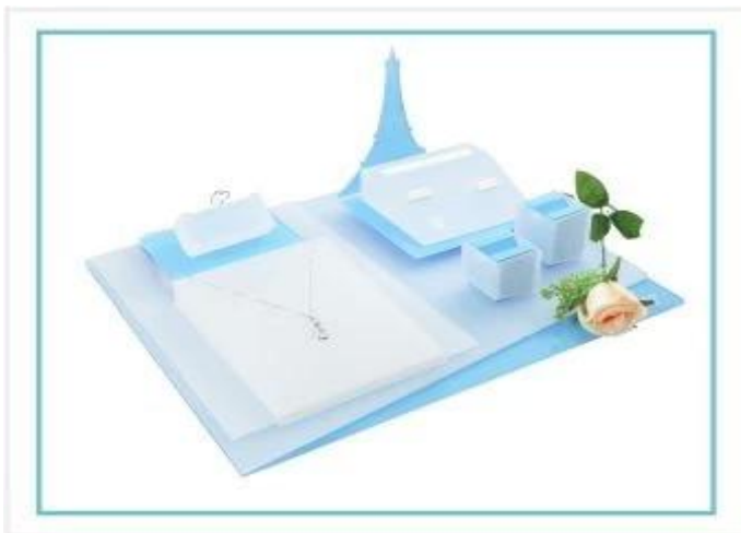
Exposição de jóias