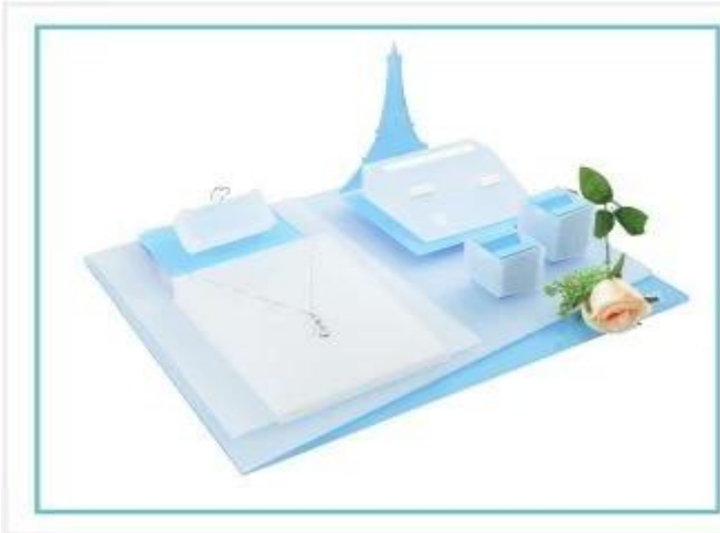
Exibição de jóias