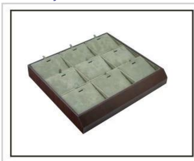
Bandejas de jóias