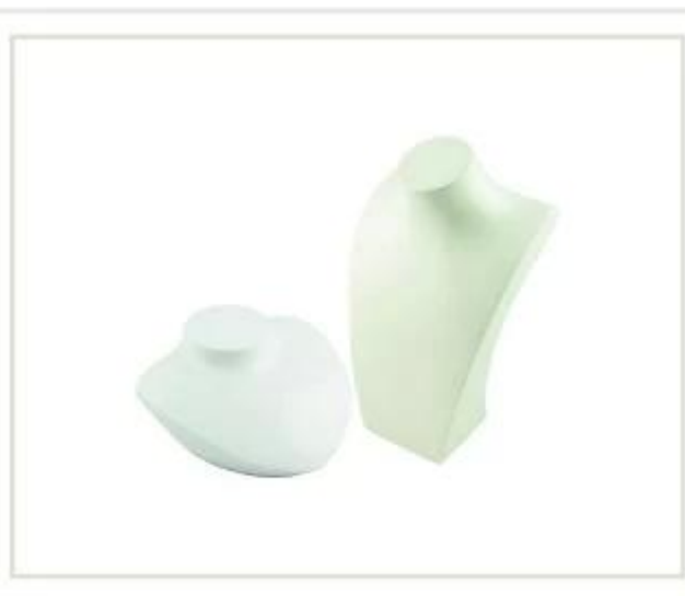
suporte de colar