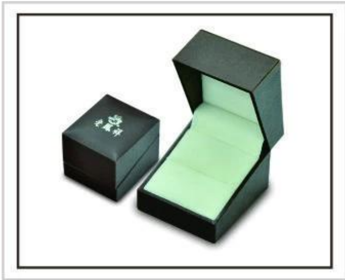
bandejas de joias