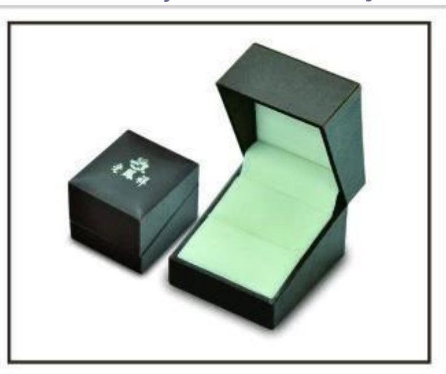
caixas de jóias