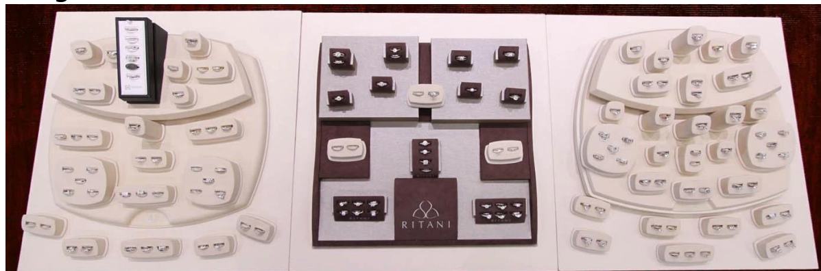
Imagem do Produto:

Outros produtos que você pode interessar: