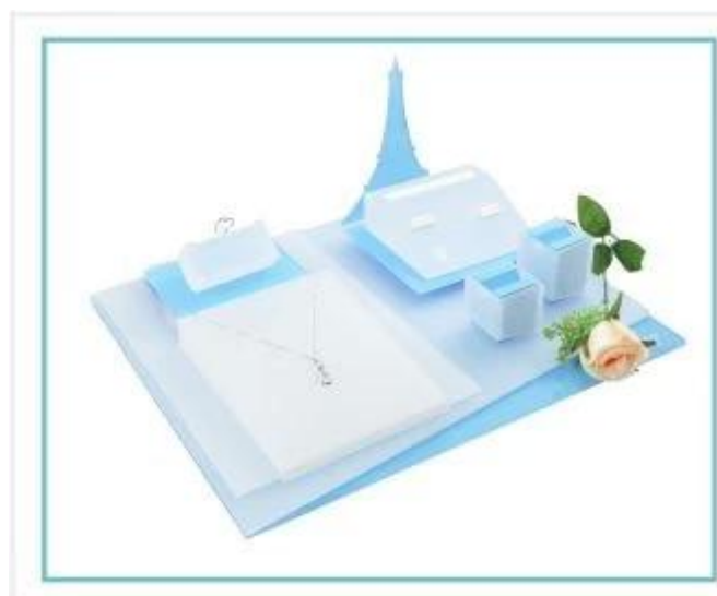
Exibição de jóias

Outros produtos que você pode interessar: