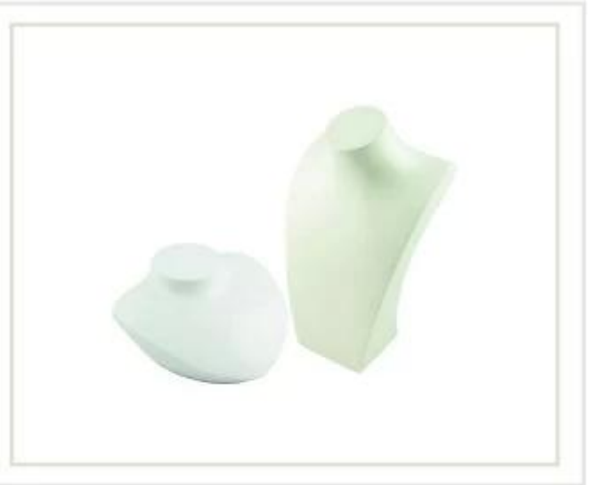
suporte de colar