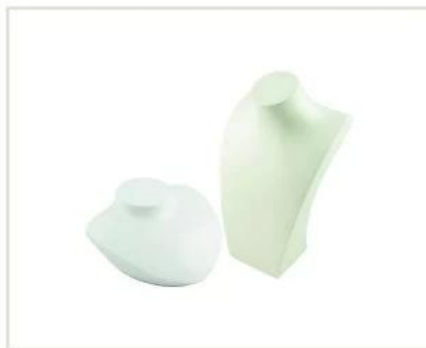
Banca de colar