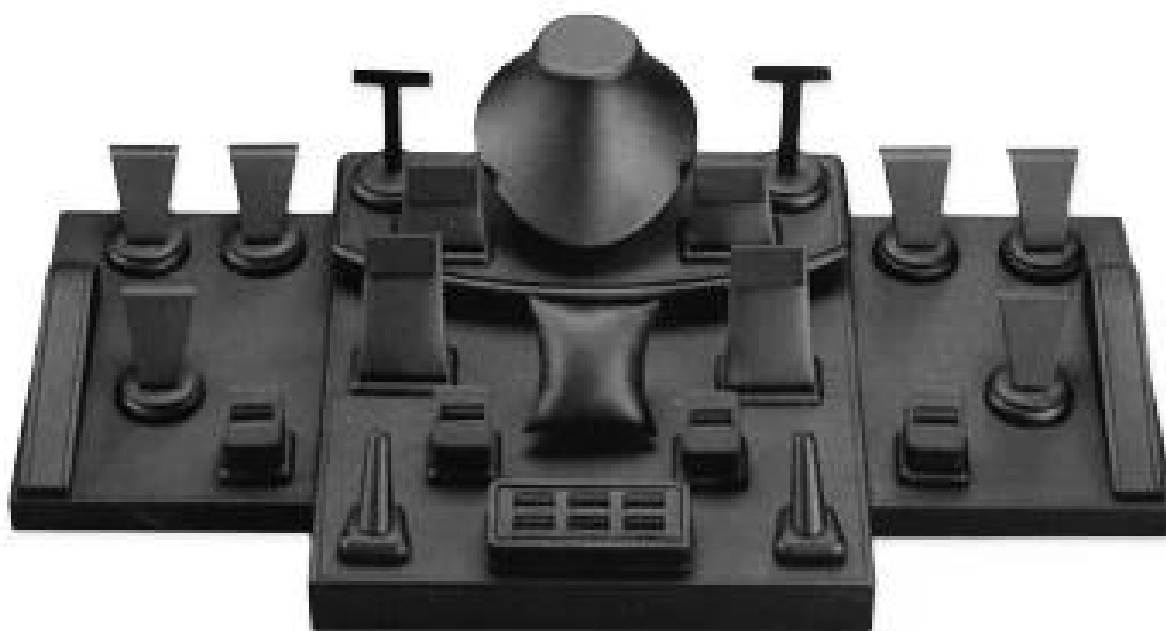
Immagine di riferimento

vendita calda shenzhen esposizione dei monili set personalizzato Fancy lusso verniciato lucido legno negozio vetrina esposizione dei monili impostato