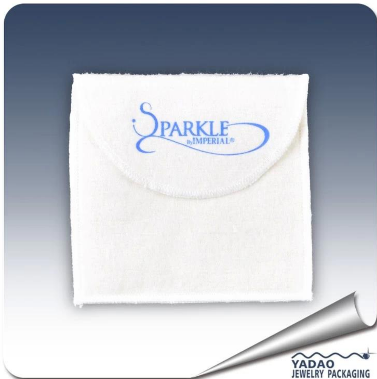
Immagine 3 di prodotto: