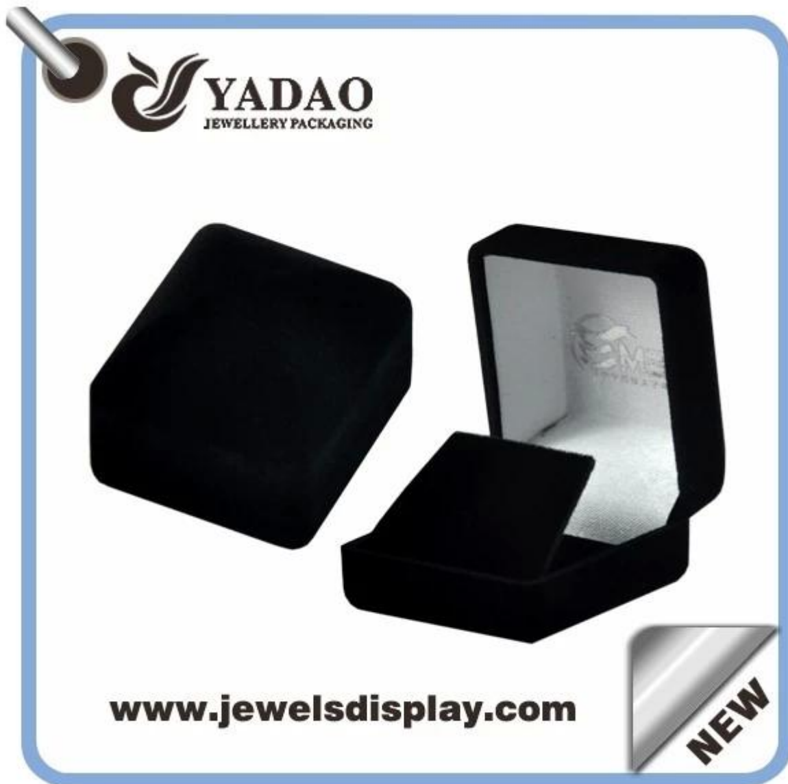
Foto di promozione piccoli simpatici neri scatole di velluto, orecchino casi di gioielli, orecchini cassapanche di stoccaggio per il negozio di gioielli e vetrine

Promozionali piccoli carino scatole di velluto nero, orecchino casi monili dell'orecchino, cassapanche di stoccaggio orecchino per gioielleria e vetrine