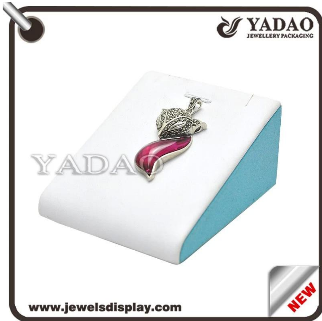
Immagine dei prodotti:

Pelle bianca OEM gioielli espositore per pendent espositore