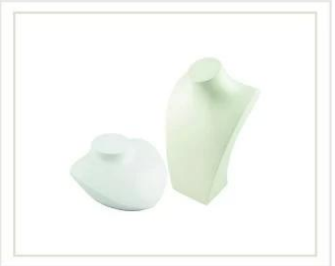
Esposizione dei gioielli Stand della collana