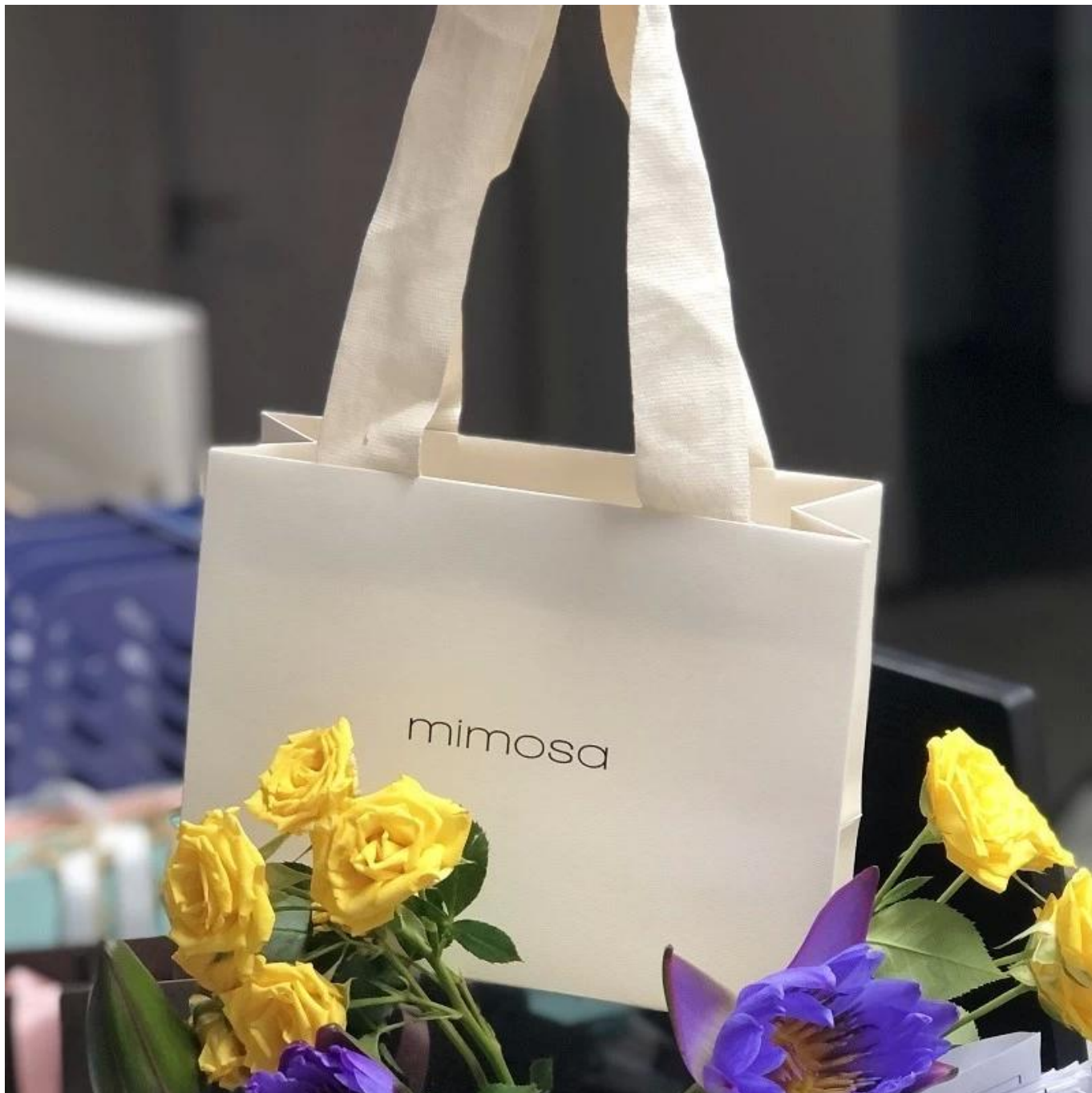
□ L'ufficio di Yadao □