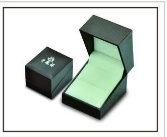
contenitori di monili