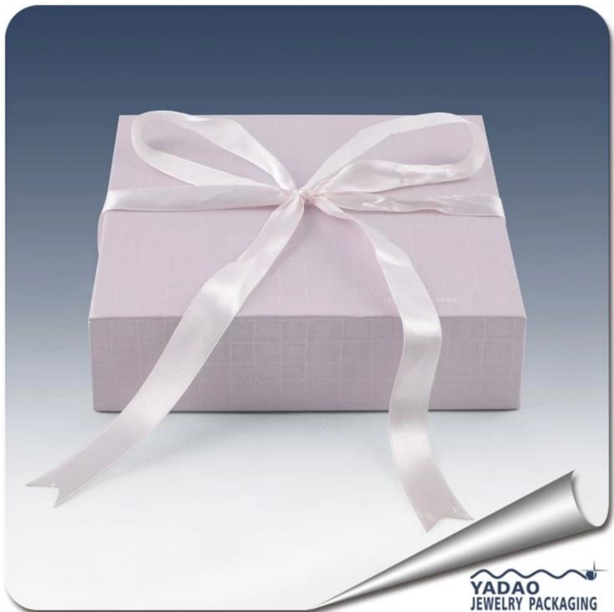
Foto di fabbrica cinese di fascia High scatole di imballaggio gioielli di carta per l'anello, la collana, braccialetto e braccialetto per gioielleria regalo e favori di partito all'ingrosso

Fabbrica cinese di fascia High scatole di imballaggio gioielli di carta per l'anello, la collana, braccialetto e braccialetto per gioielleria regalo e bomboniere all'ingrosso