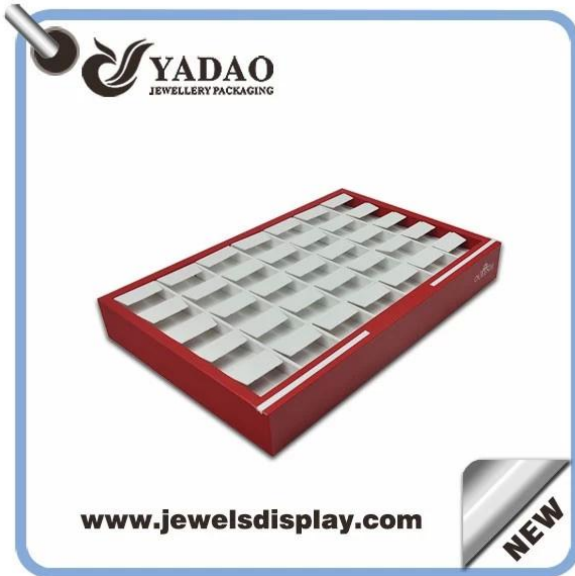
Foto di produttore cinese di vassoi di visualizzazione promozionali artigianali bianche e rosse in pelle, orecchino titolare vassoio espositore, vassoi di presentazione orecchino

Produttore cinese di vassoi di visualizzazione promozionali artigianali bianche e rosse in pelle, orecchino titolare vassoio espositore, vassoi di presentazione orecchino