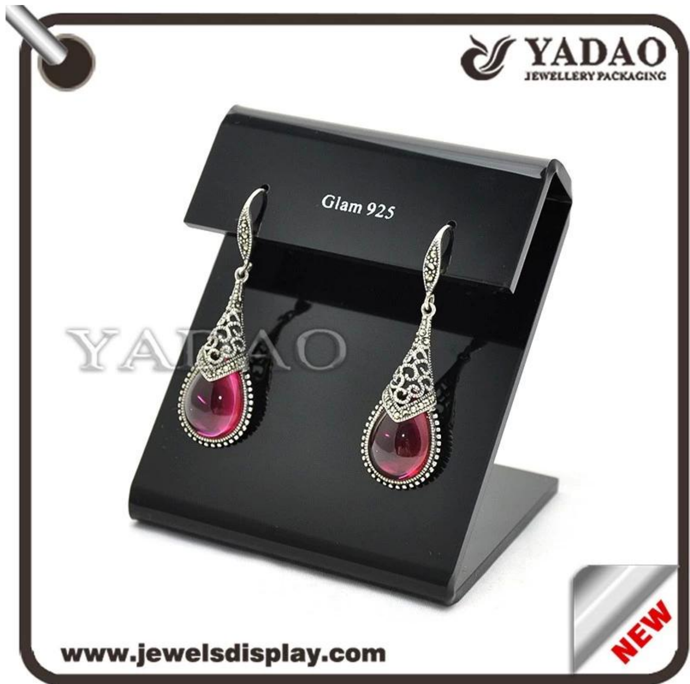
Immagine dei prodotti:

Nero acrilico espositore orecchino made in China