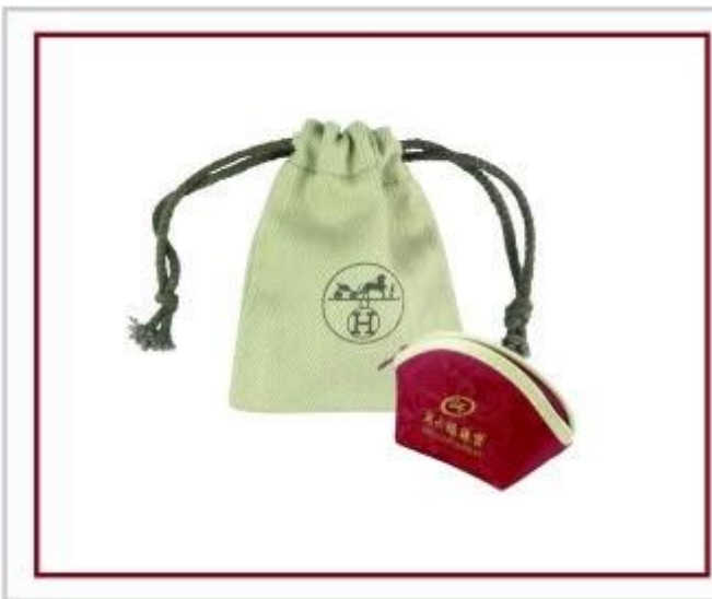
sacchetto di gioielli