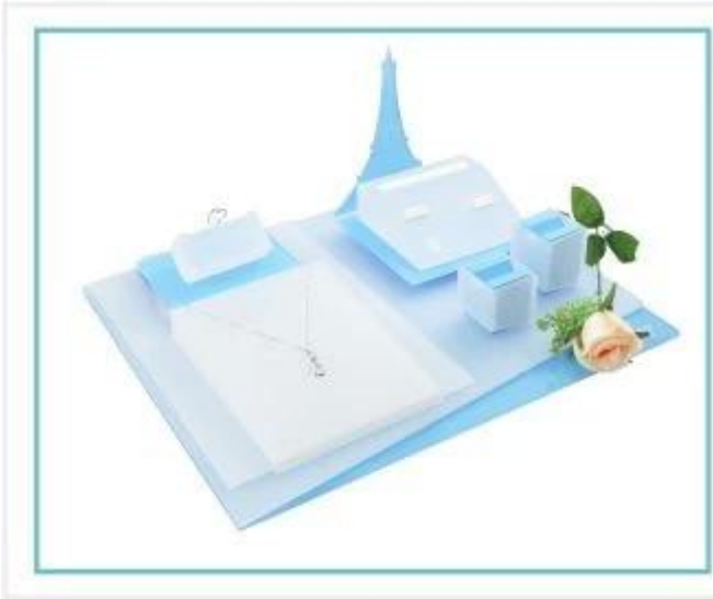
esposizione di gioielli