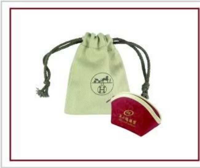
sacchetto di gioielli