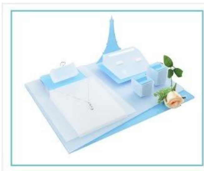
esposizione di gioielli

Altri prodotti che potete interessato in: