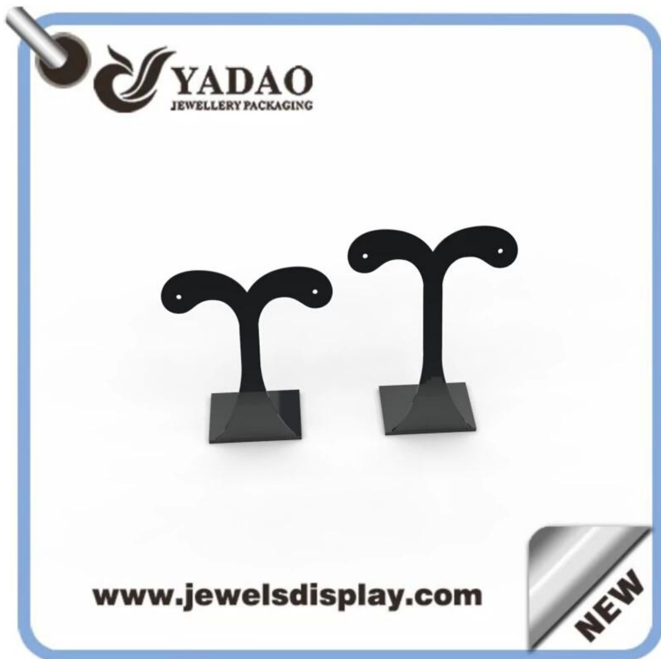
Immagine di riferimento