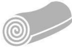
Jewelry Roll bag