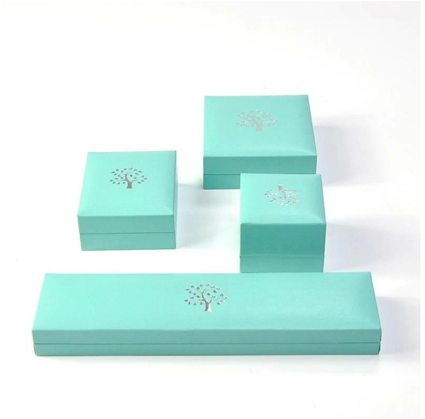
Όμορφη καυτή σφράγιση