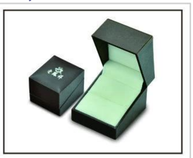
Boîtes à bijoux