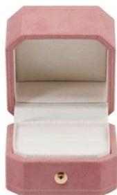
ring box: 5.9*5.9*5.2

*All off the size are measured by hand,as for different measurement method Please refer to actual products if there is any error (unit: cm)