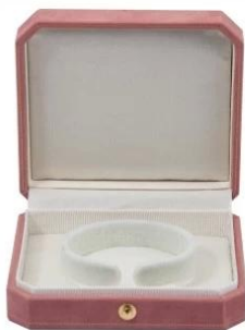
bangle box: 9.3*8.8*2.8