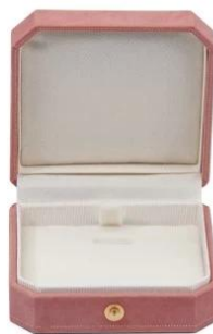
pendant box: 7.4*7.6*3