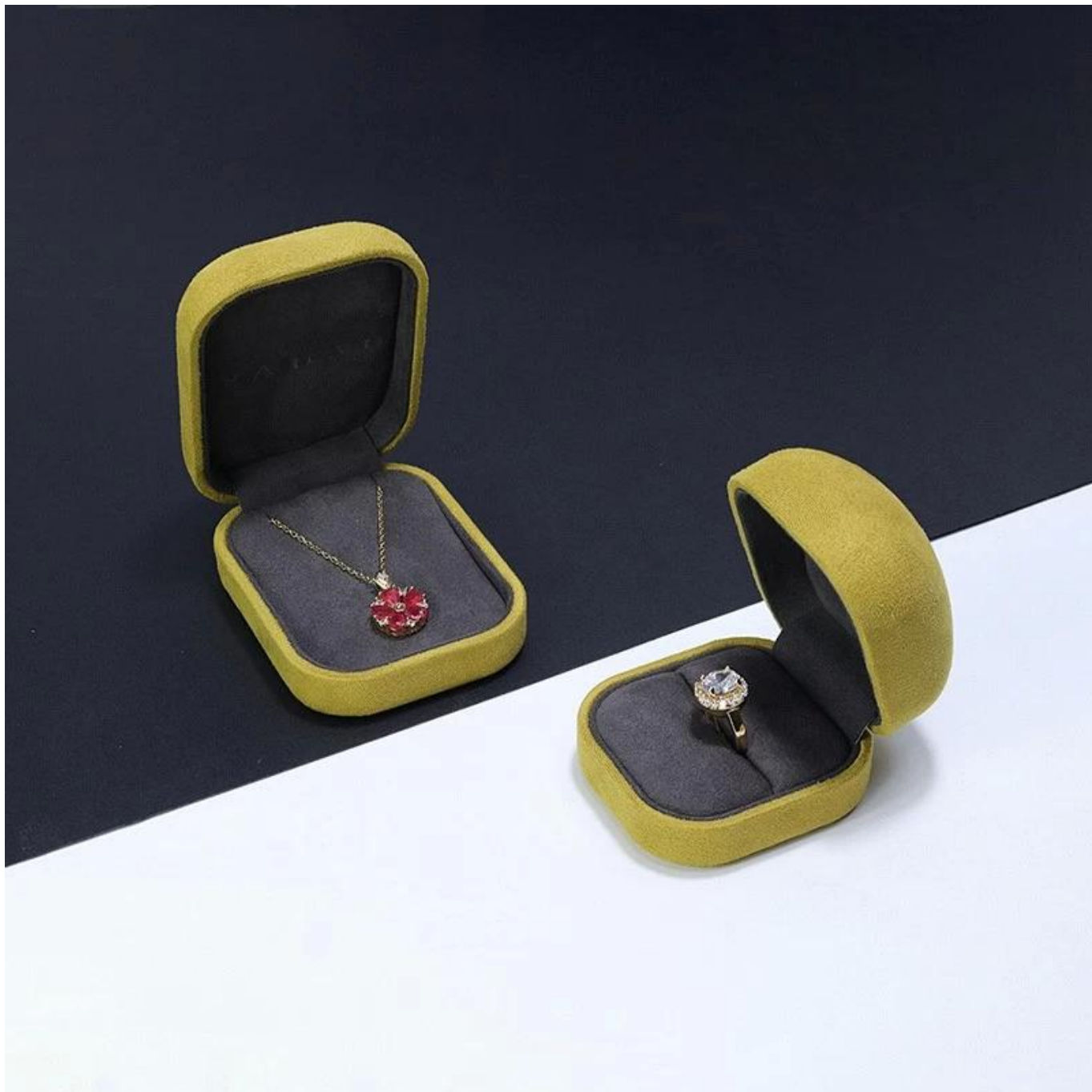
□ Le bureau de Yadao □