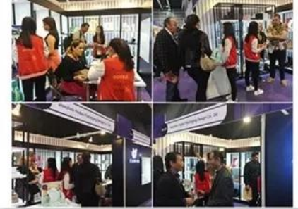
2018 Hongkong international jewellery show