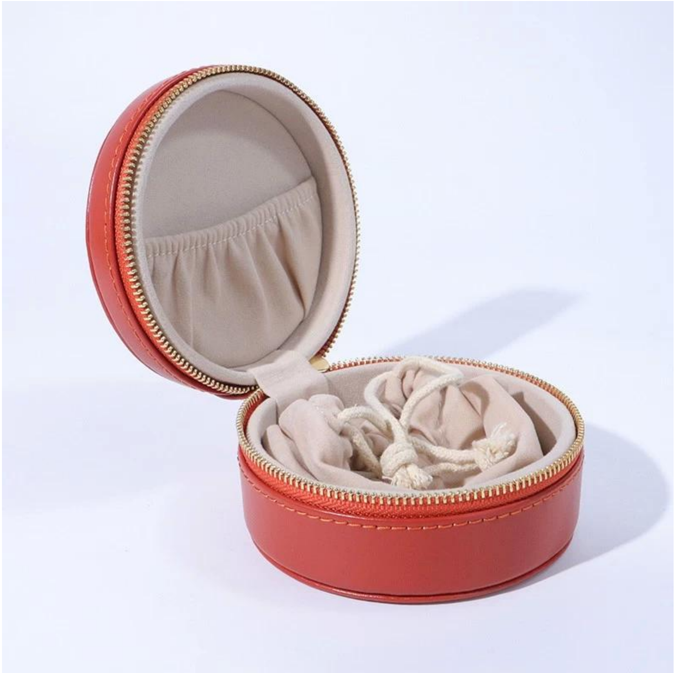
□ Le bureau de Yadao □