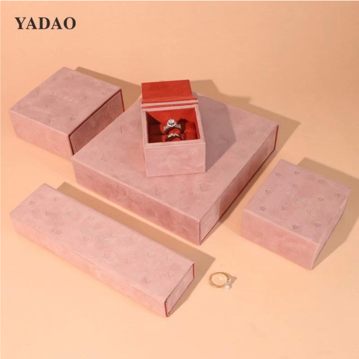
□Le bureau de Yadao□