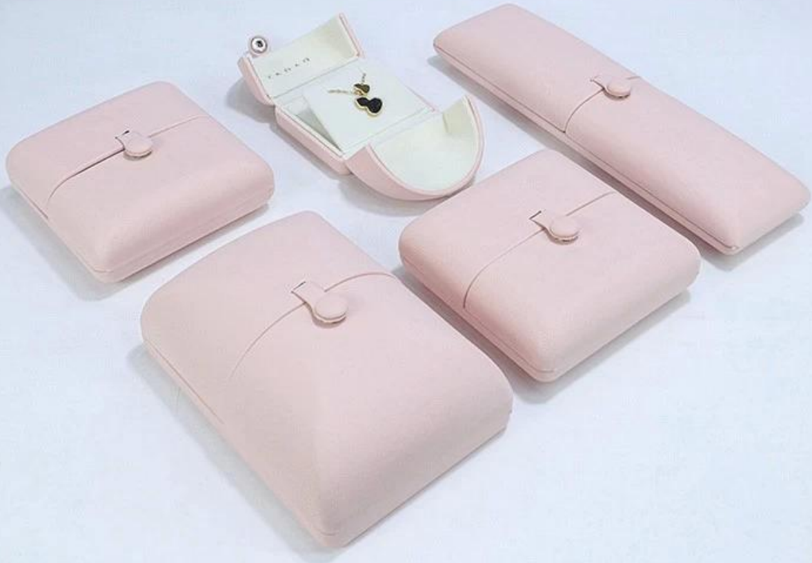
□Le bureau de Yadao□