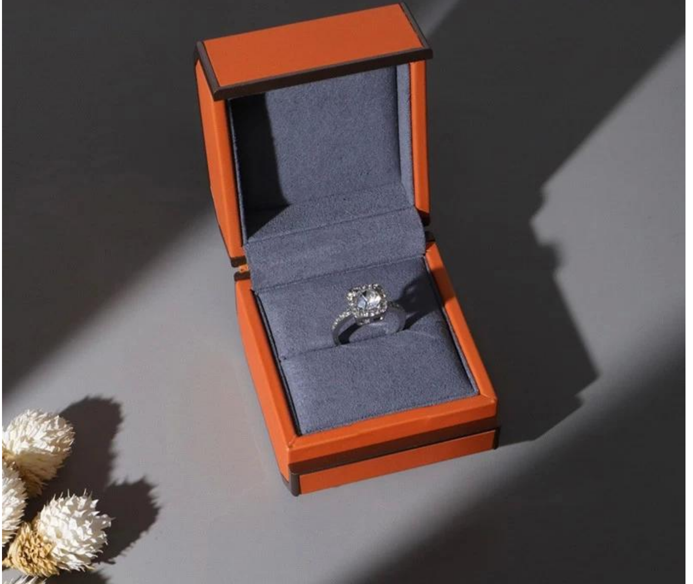
□ Le bureau de Yadao □