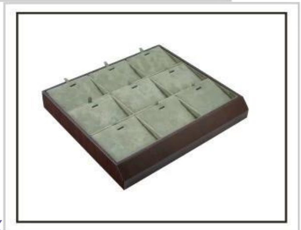
Coffret à bijoux Supports à bijoux