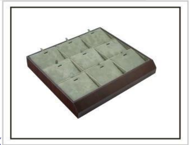
Coffret à bijoux Supports à bijoux