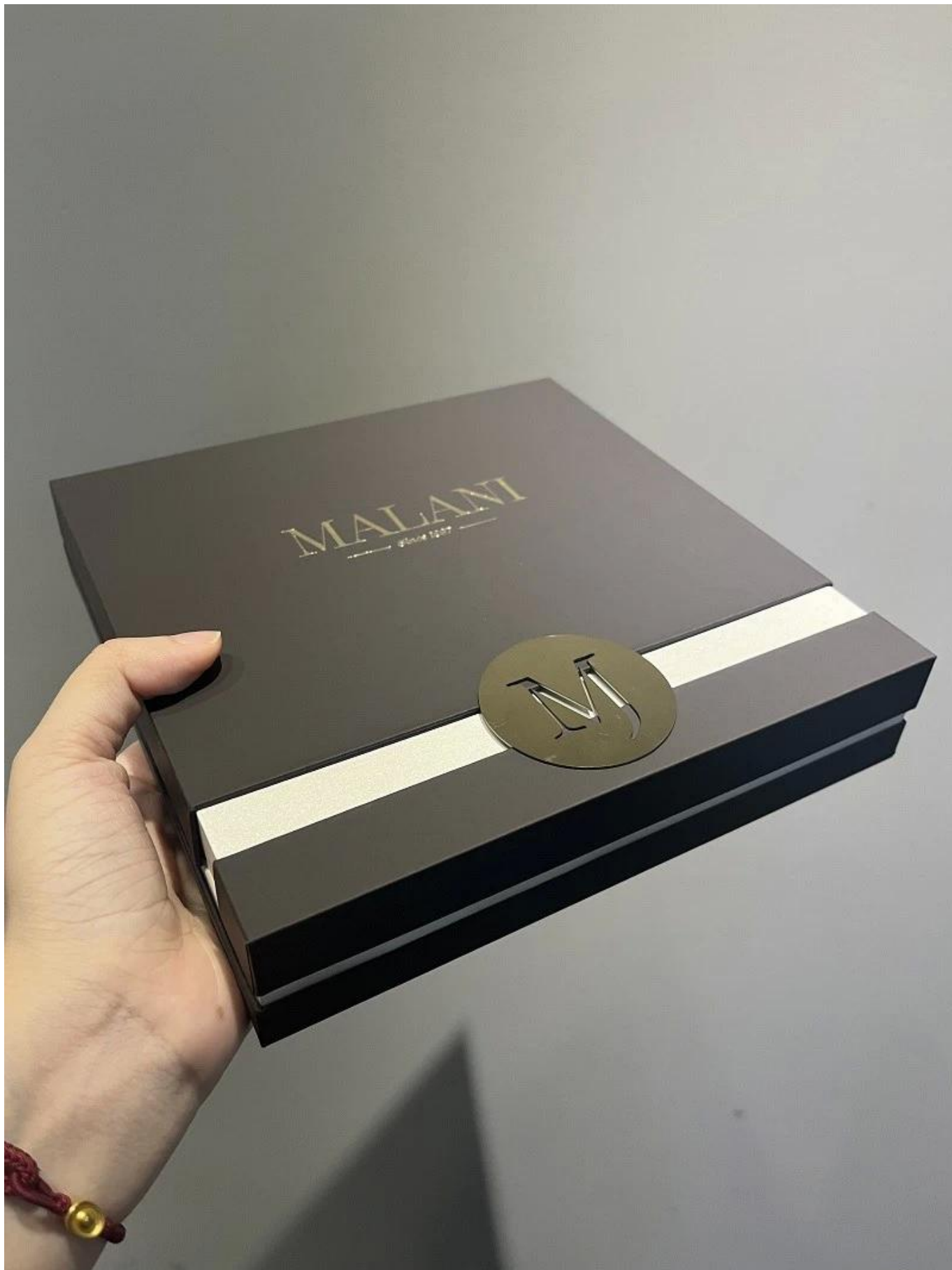
□Le bureau de Yadao□