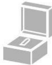
Jewelry Display Stands