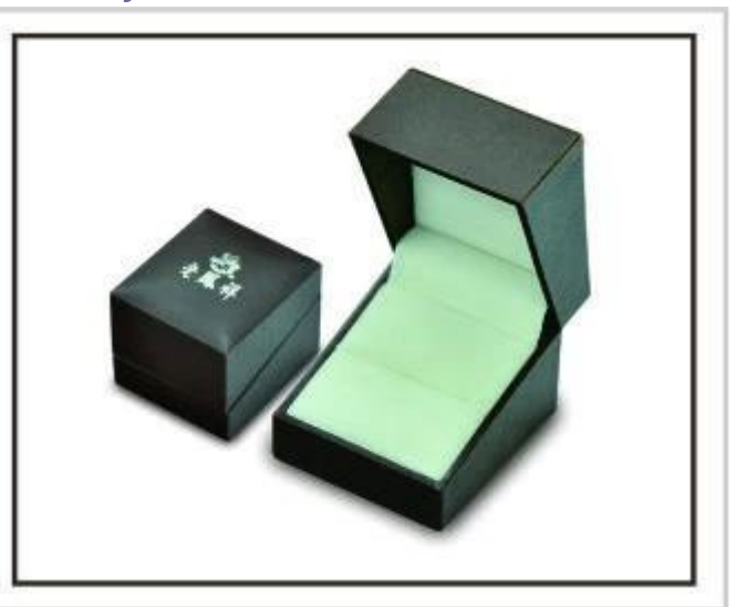
Boîtes à bijoux