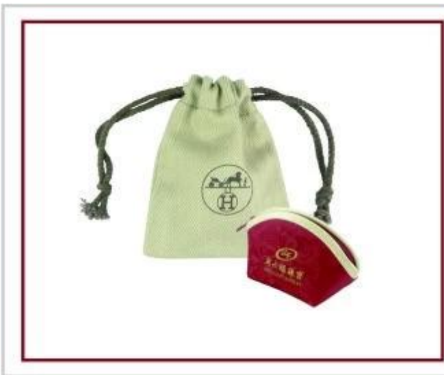
sachet de bijoux