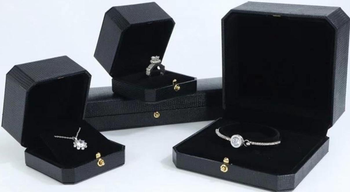
□Le bureau de Yadao□