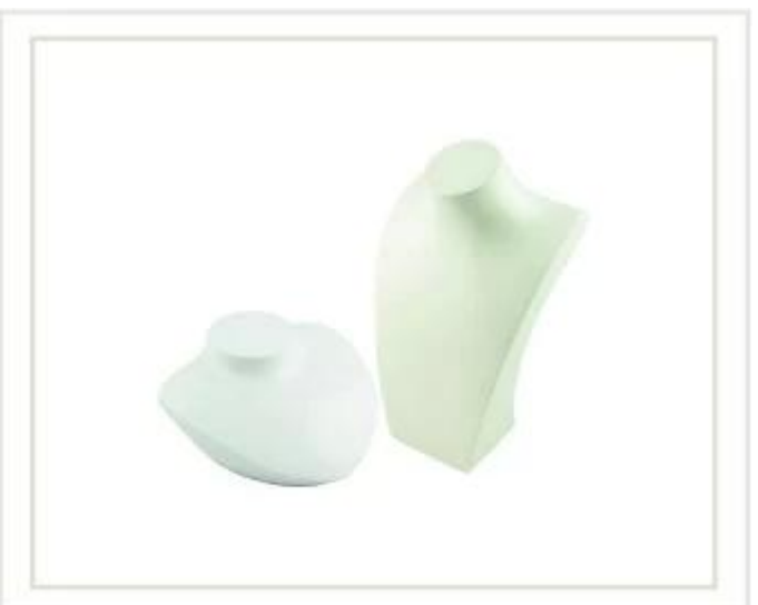
stand de collier