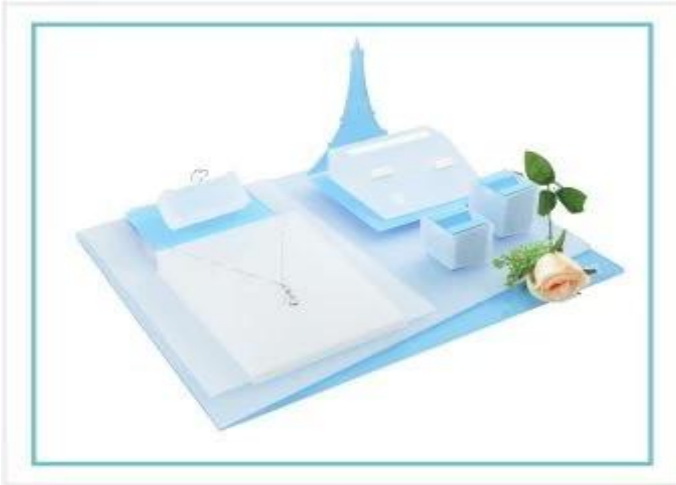
Exhibición de la joyería