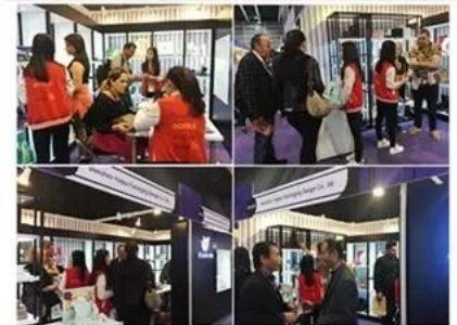
2018 Hongkong international jewellery show