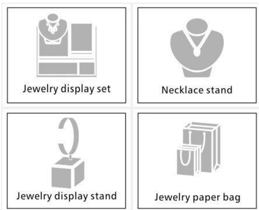
Jewelry display set