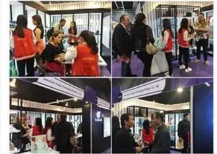
2018 Hongkong international jewellery show