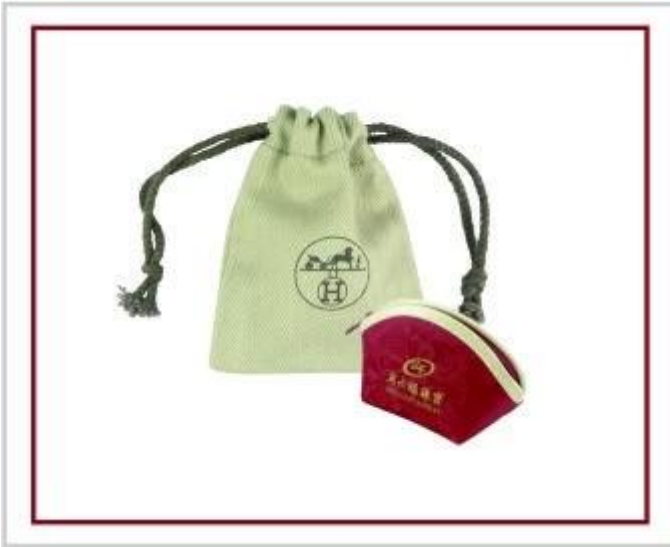
Bolsa de la joyería