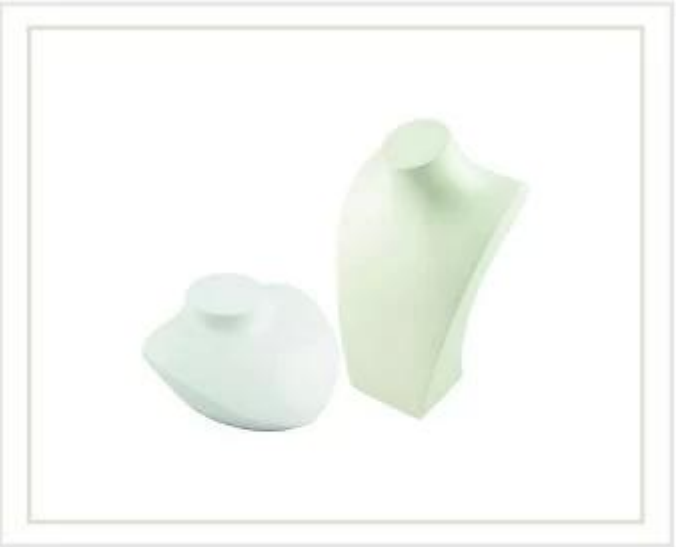
exhibición de la joyería