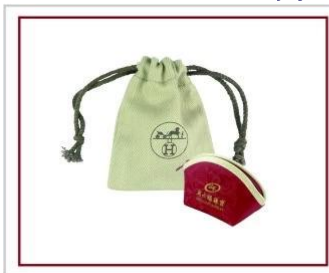
Bolsa de la joyería