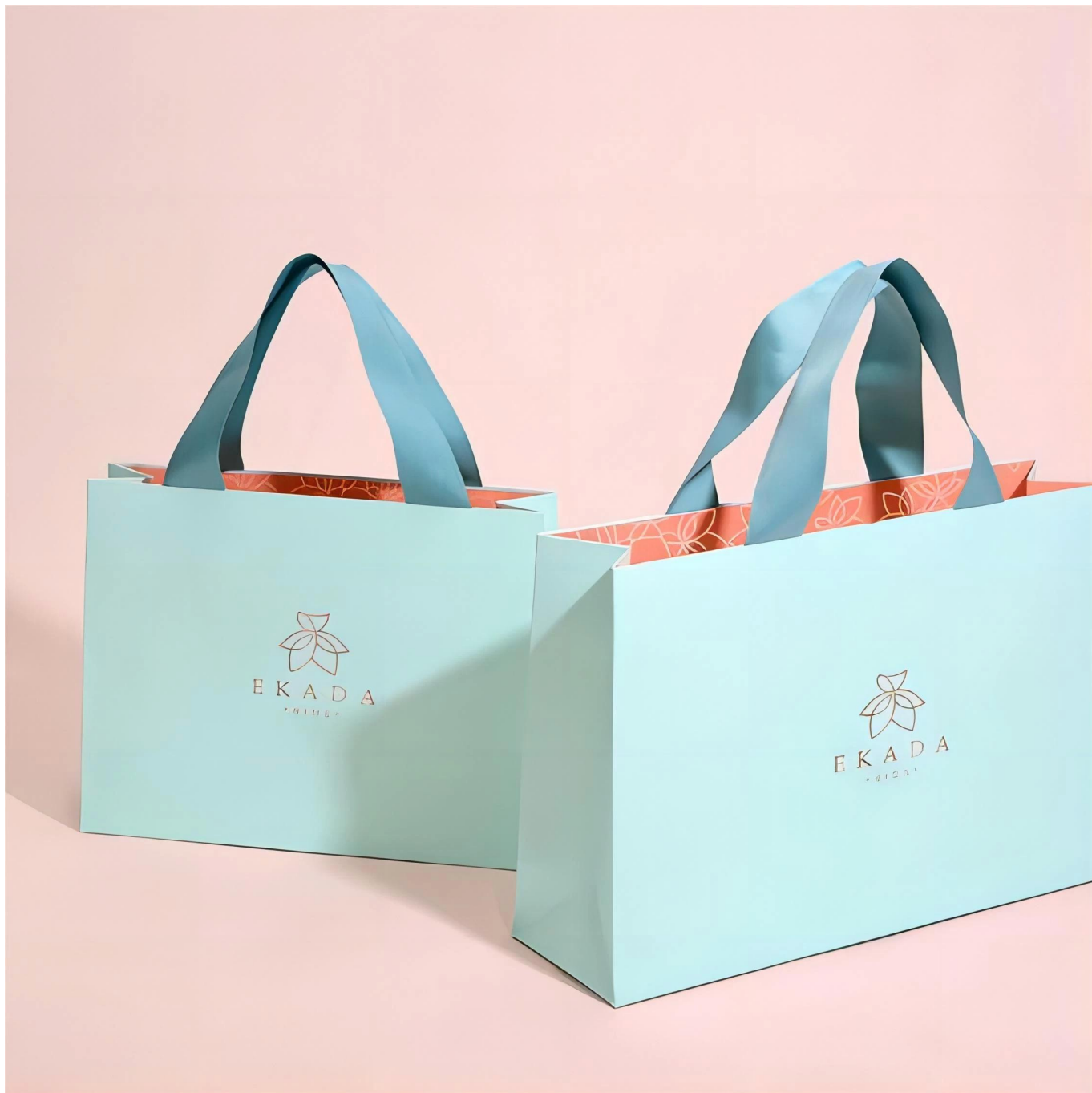
oficina de yadao