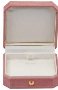
pendant box: 7.4*7.6*3