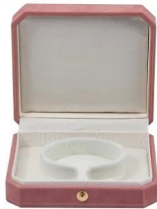
bangle box: 9.3*8.8*2.8