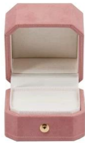
ring box: 5.9*5.9*5.2

*All off the size are measured by hand,as for different measurement method Please refer to actual products if there is any error (unit: cm)